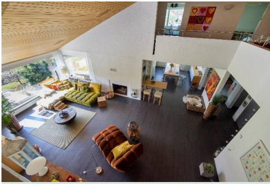
Blick von der Galerie