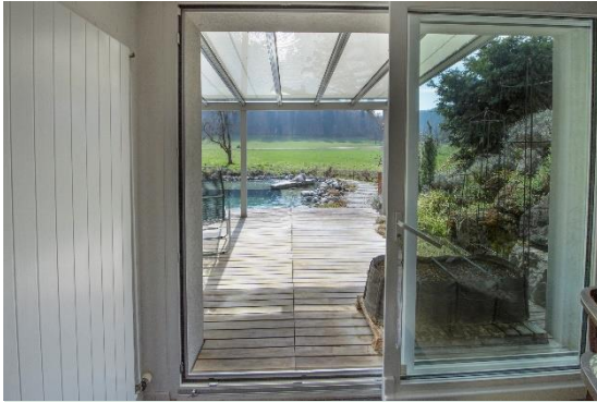
Blick zum Oeko-Schwimmteich