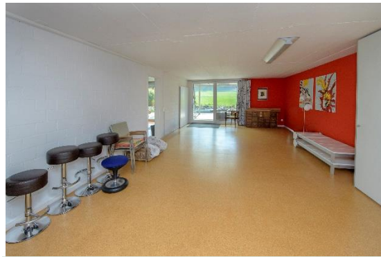
Mehrzweckraum im Untergeschoss