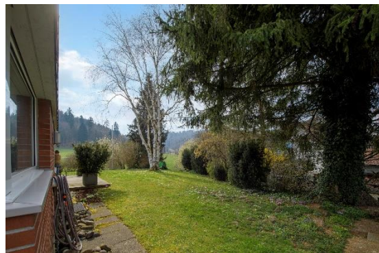
Umgebung mit einheimischer Bepflanzung