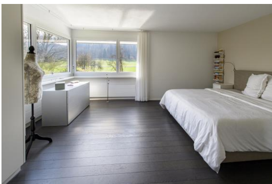
Elternschlafzimmer im Erdgeschoss...