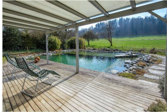
Terrasse mit Pergola