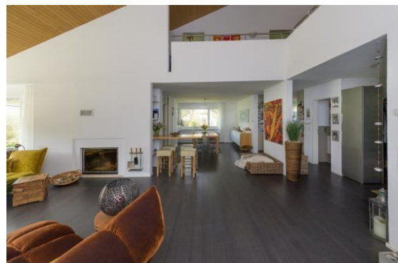
Blick ins Esszimmer (Cheminée)