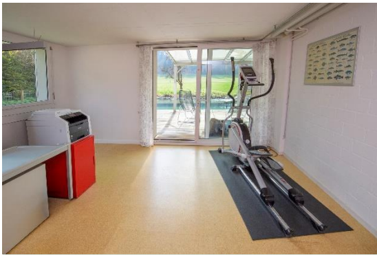
Büro/Fitnessraum im Untergeschoss