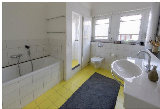
Bad im OG