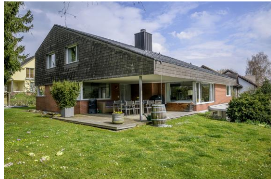
Sitzplatz im Erdgeschoss SW