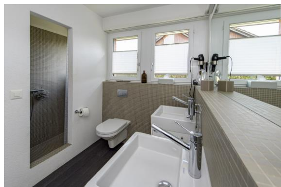
...mit integriertem Badezimmer