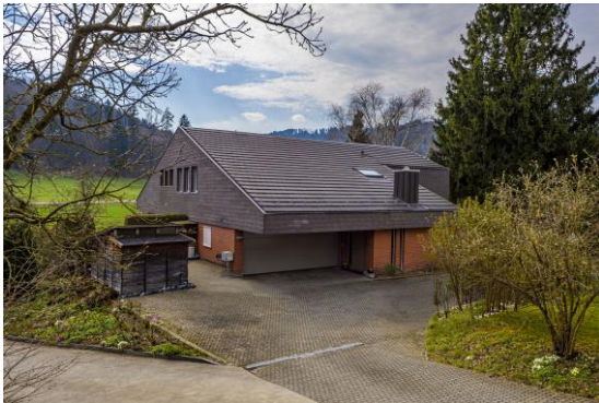
Ansicht Eingangsseite NO